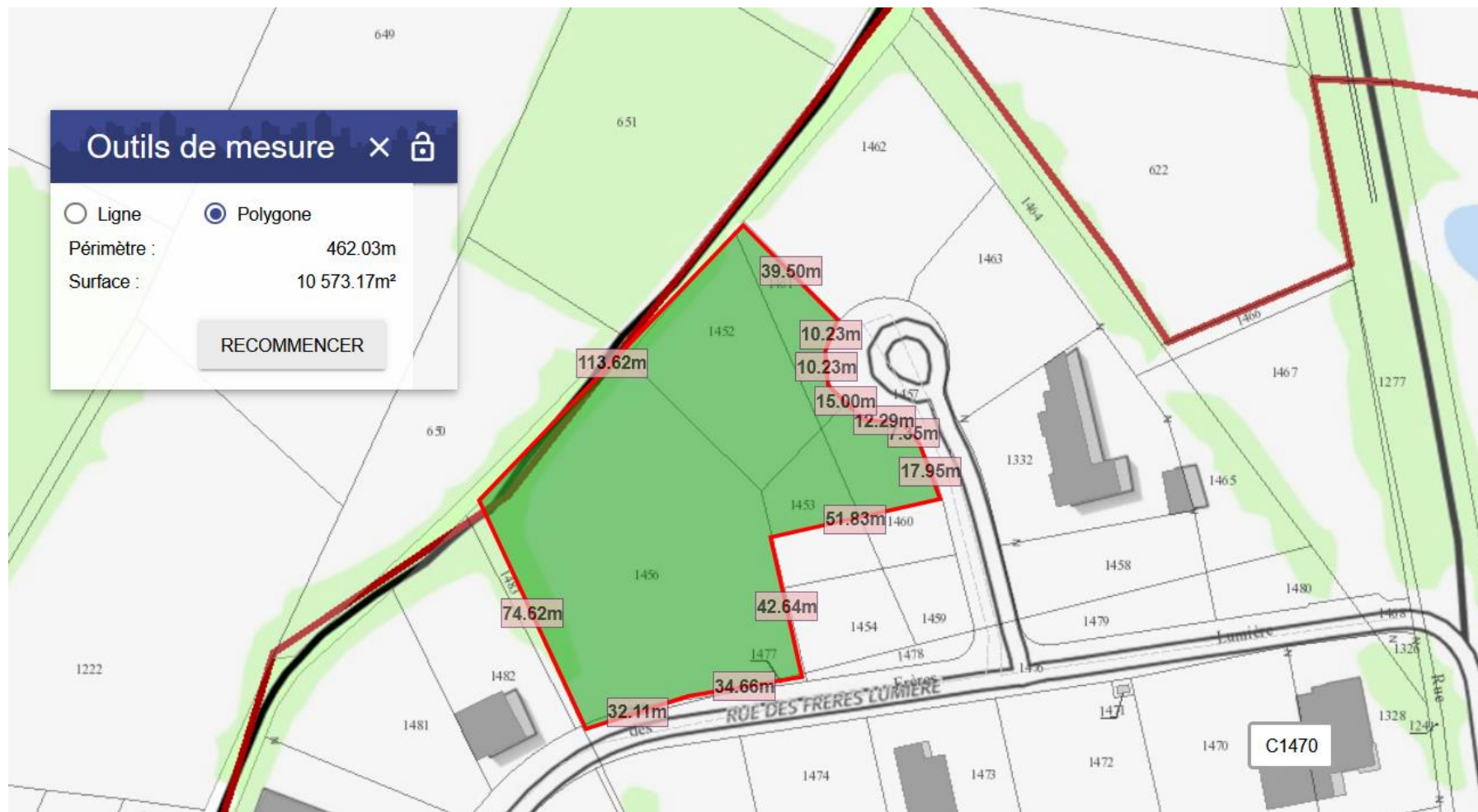
Emprise de la parcelle concernée

Le terrain proposé pour l'implantation de la future déchèterie de Blain a une superficie de 10 500 m 2 . La Communauté de Communes est propriétaire du terrain, actuellement non occupé et viabilisé.